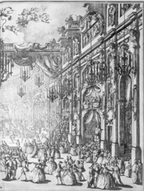
Spettacolo fattasi nel Real Teatro di S. Carlo

Grand bal au théâtre San Carlo de Naples, à l'époque le plus grand d'Europe. (Gravure de Luis Joseph Lorrain, 1749)