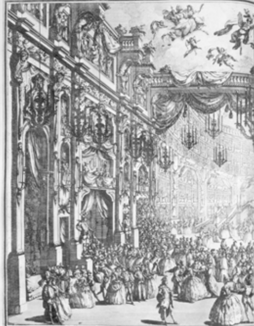
Disegno della Gran Festa da Ballo in D